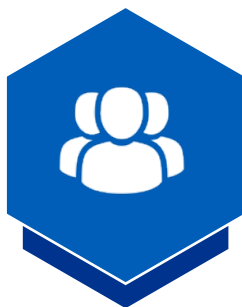
Команда КСВ (координатори за напрямками)