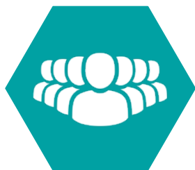
Пріоритетні напрями діяльності КСВ в Україні